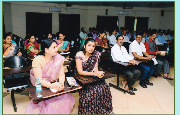
संचालक व कर्मचारी प्रशिक्षणास उपस्थित संचालक व कर्मचारी वृंद