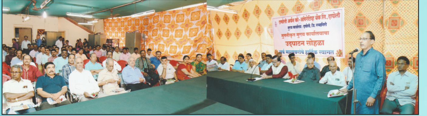
नुतनीकृत मुख्य कार्यालयाचे उद्घाटन प्रसंगी उपस्थित मान्यवरांसह संचालक मंडळ