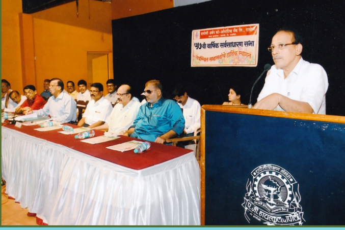
५७ व्या वार्षिक सर्वसाधारण सभेप्रसंगी संचालक मंडळ