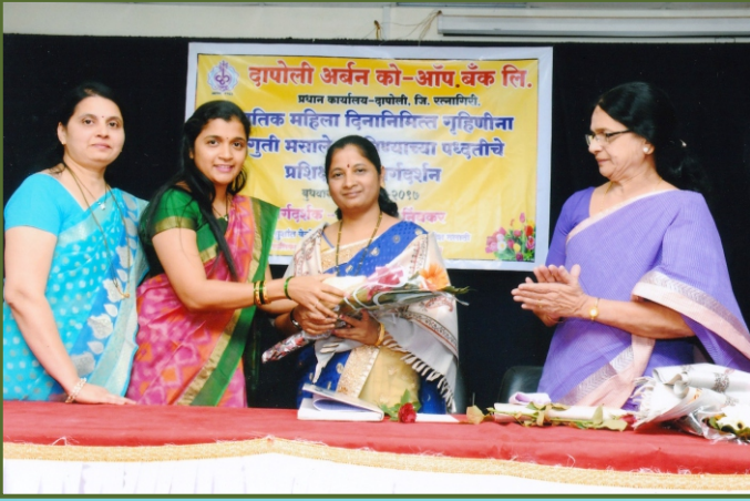
महिलांसाठी आयोजित प्रशिक्षण कार्यक्रमात मान्यवरांचा सत्कार करताना संचालिका