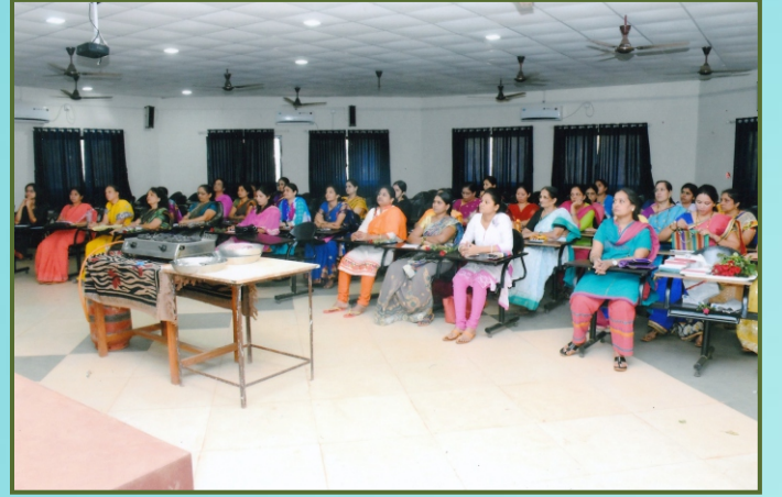
महिलांसाठी आयोजित प्रशिक्षण कार्यक्रमात उपस्थित महिलावर्ग