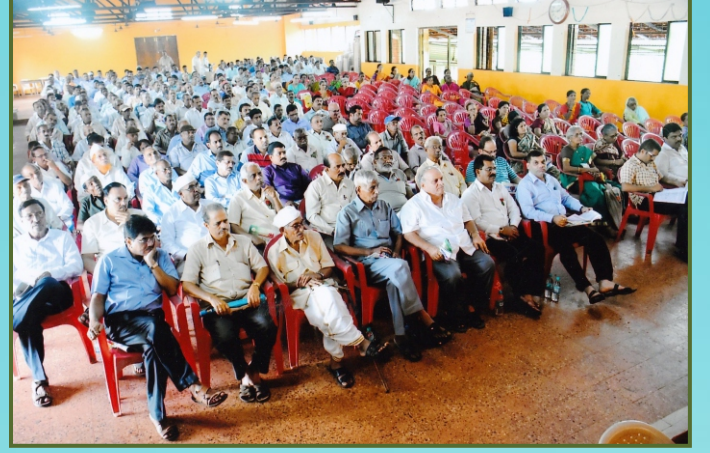
५७ व्या वार्षिक सर्वसाधारण सभेप्रसंगी उपस्थित सन्माननीय सभासद