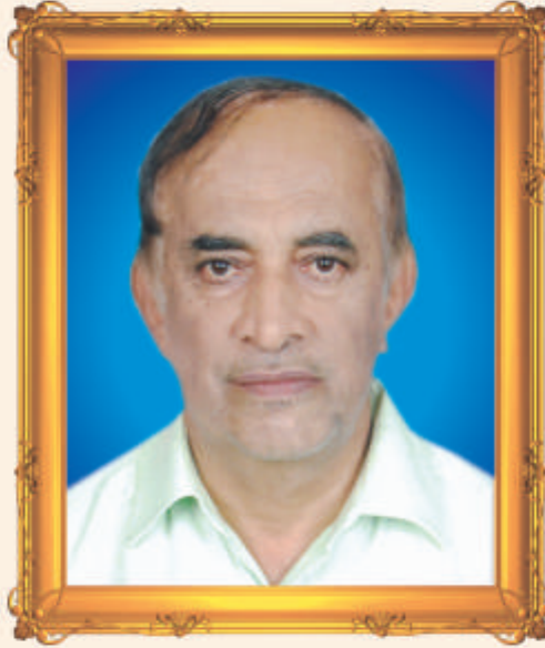
पै.अ.गफार अ. सत्तार रखांगे मृत्यू दि. ३०/१२/२०२२